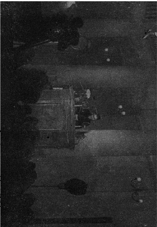
लेनिनग्राद शुनिवर्सिटी में 'रवीन्द्र-दिवस' पर भाषण देते हुए लखनऊ